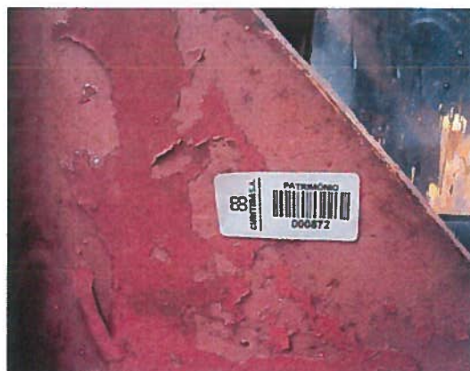
FOTO 12: Placa de identificação do número de patrimônio do item 02.