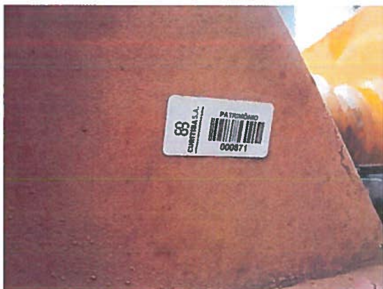
FOTO 07: Placa de identificação do número de patrimônio do item 02.