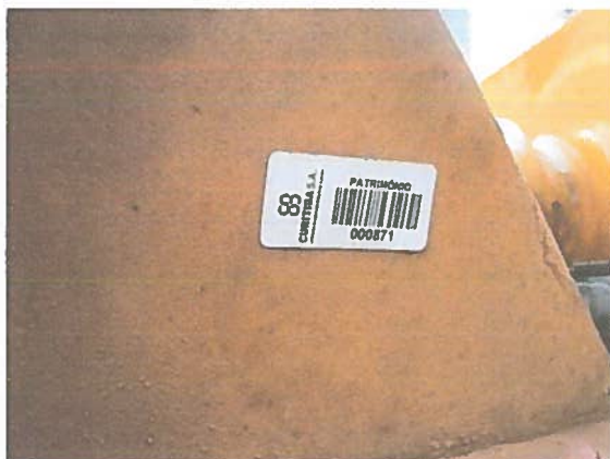
FOTO 07: Placa de identificação do número de patrimônio do item 02.