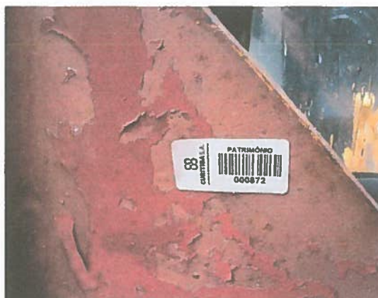
FOTO 12: Placa de identificação do número de patrimônio do item 02.